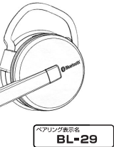
ペアリング表示名 BL-29