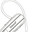
ペアリング可能な Bluetoothモデル BL-44

安全上のご注意 1 1 充電時は充電ケーブルの接続方法 → 10-16 2 2 充電ケーブル → 11-10 3 3 充電ケーブルの接続方法 → 11-10 4 4 充電ケーブルの接続方法 → 11-10 5 5 充電ケーブルの接続方法 → 11-10 6 6 充電ケーブルの接続方法 → 11-10 7 7 充電ケーブルの接続方法 → 11-10