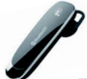
ペアリング表示音 BL-67