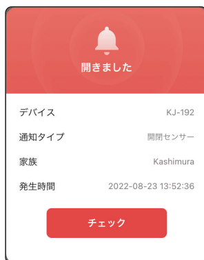
ポップアップ画面